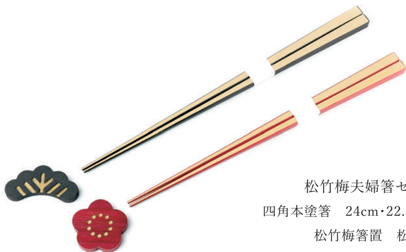
松竹梅夫婦箸セット

長さの異なる竹箸二膳と、縁起物をモチーフとした箸置二個のセットです。 普段使いはもとより、結婚祝いなどのギフトにもお勧めです。