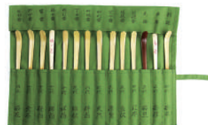
歴代茶杓表千家流 布袋入