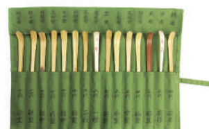
歴代茶杓裏千家流 布袋入