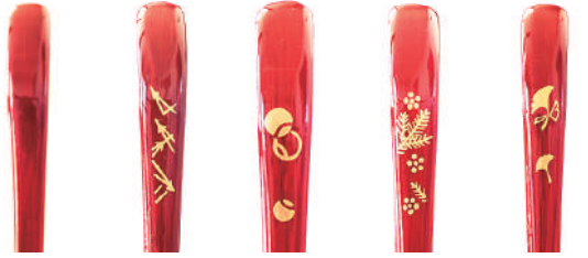
無地 松葉 つぼつぼ 松竹梅 いちょう