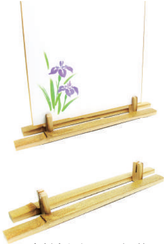
色紙立ち上がり ゴマ竹