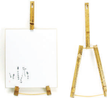
色紙立て掛け ゴマ竹